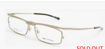
C/6: シャイニーシャーリングゴールド SOLD OUT