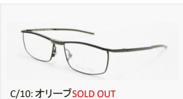
C/10: オリーブSOLD OUT