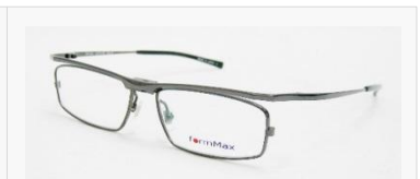
C/7: シャイニーグレー SOLD OUT