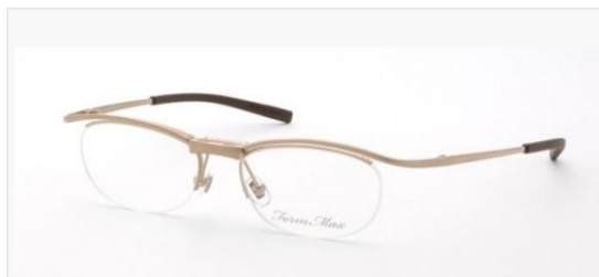
C/1: マットシャーリングゴールド