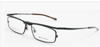
C/3: シャイニーブラック SOLD OUT