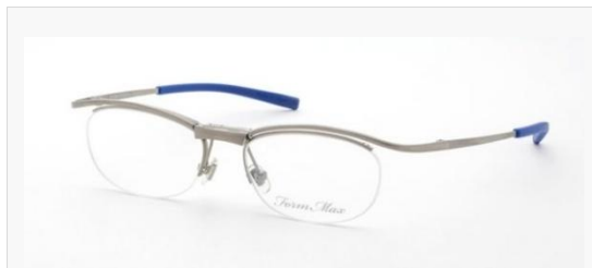
C/3: マットシャーリングルテ