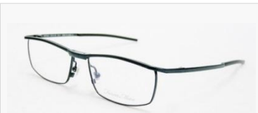
C/7: ダークネイビーSOLD OUT