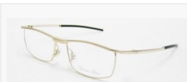
C/1: シャーリングゴールド