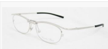
C/2: シャーリングシルバー