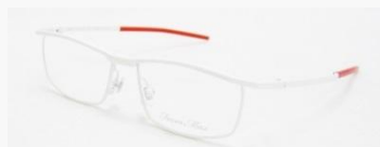
C/9: ホワイトSOLD OUT