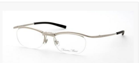
C/2: マットシャーリングシルバー