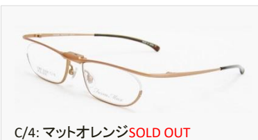
C/4: マットオレンジ SOLD OUT