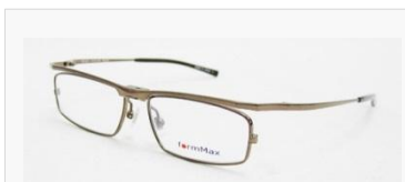
C/8: シャイニーブラウン SOLD OUT