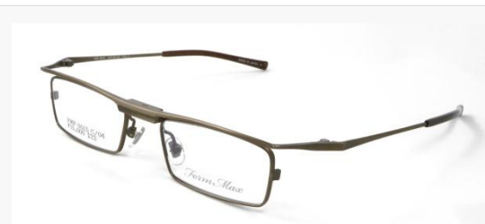
C/4: マットシャーリングダークブラウン