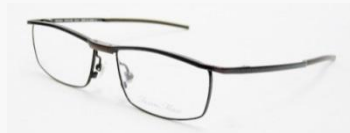
C/6: バーガンディSOLD OUT