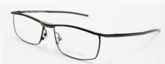
C/5: ダークブラウンSOLD OUT