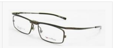
C/4: マットブラウン SOLD OUT