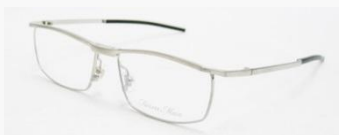
C/2: シャーリングチタン