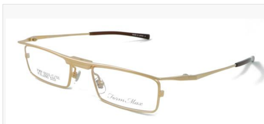
C/1: マットシャーリングゴールド