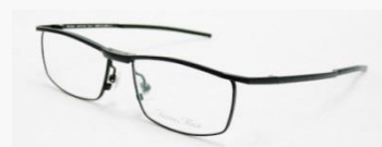
C/3: マットブラックSOLD OUT