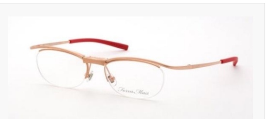
C/4: マットシャーリングピンクゴールド