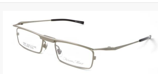
C/2: マットシャーリングライトグレー