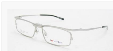
C/2: マットチタニウムグレー